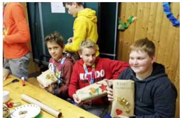
cityChallenge der NMS Scharnstein