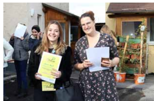
Übergabe der Urkunden für die openMinderInnen

6 Schulen mit insgesamt 264 SchülerInnen haben bei der Premiere der „cityChallenge“ mitgemacht und sich als openMinderInnen qualifiziert. Das waren wundervolle und ereignisreiche Tage!