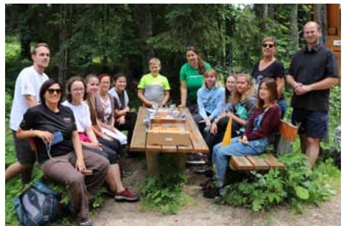
Das Abschluss-Picknick am Schwemmkanal

Zum Abschluss veranstalteten wir ein Picknick an der Grenze, das an das Paneuropäische Picknick vom 19. August 1989 erinnern sollte. Es war ein sehr intensiver und schöner Austausch und bleibt sicherlich allen 11 TeilnehmerInnen noch lange in Erinnerung.