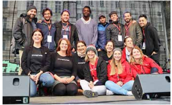
Das youngCaritas-Team mit „Scheibsta und die Buben“ und „Hinterland“.

Anlässlich unseres 20-jährigen Bestehens feierten wir unseren Geburtstag mit ca. 180 BesucherInnen bei einem Mini-Festival am Linzer Hauptplatz. Ordentlich eingeeizt haben „Scheibsta und die Buben“, „Hinterland“ und „Jahna“. Für kulinarischen Genuss sorgte der Speisewagen der Caritas sowie ein Buffet. Um auch für die Jüngsten unter uns ein attraktives Angebot zu bieten, konnten diese durch den Spielplatz der Vielfalt wandern und bei sechs Stationen bewährte youngCaritas-Methoden kennenlernen.