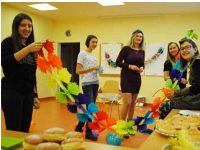
Die actionPoolerInnen bereiteten das Fest vor.

„Jetzt wird der Fasching mal so richtig gefeiert!“ Nach diesem Motto verbrachten unsere actionPoolerInnen einen Nachmittag lang im Haus für Mutter und Kind in Linz. Superman, Cinderella und Batman erschienen zur Feier und die Kinder wurden gleich mal geschminkt. Aus Luftballons wurden Tiere geformt. Das größte Highlight war aber eine Raketenstation, wo die Kinder ihre gebastelten Raketen durch den Raum pusten durften.