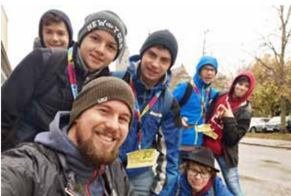
cityChallenge des BRG Franziskanerinnen Wels