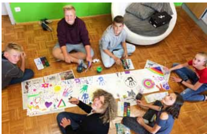
Die SchülerInnen der vierten Klasse hatten viele kreative Ideen, wie sie Vielfalt und Inklusion künstlerisch darstellen.

Die dritten und vierten Klassen der NMS Gutau starteten das neue Schuljahr gleich mit einem dreitägigen Projekt, welches vom Zivilinvalidenverband OÖ initiiert und von der youngCaritas mit den SchülerInnen umgesetzt wurde.