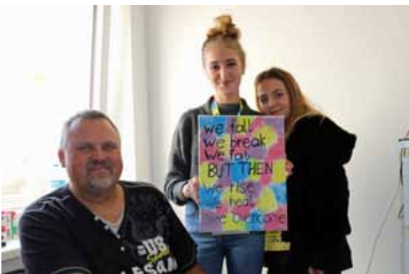
cityChallenge der Fachschule Oblatinnen in Linz

Die 264 teilnehmenden SchülerInnen setzten sich mit dem Thema „Armut in Österreich“ auseinander, meisterten die ihnen gestellten „challenges“ bravourös und wurden am Ende des Tages zu „openMinderInnen“ gekürt.